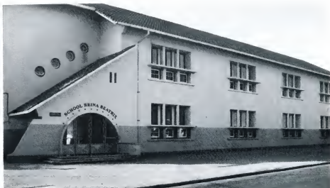
REINA BEATRIX SCHOOL: enige openbare basisschool in Playa!

komst, besteed worden aan het onderwijs. Wat ondermeer moet gebeuren, is het aanstellen van een gedeputeerde, of na 1 januari a.s. een minister, die enkel en alleen belast is met de zorg voor het onderwijs. Een persoon, die deskundig is op het gebied van het onderwijs en beschikt over een duidelijke visie hierop. Deze gedeputeerde of minister moet zich vervolgens laten bijstaan door een staf van deskundigen, die zich in teamverband op de vernieuwingsproblematiek kunnen werpen. Hijzelf zal de grote initiator van het geheel dienen te zijn. Pas dan zal de overheid in staat zijn een efficiënt en vooruitstrevend onderwijsbeleid te voeren. De op dit moment aan de bijzondere schoolbesturen formeel toekomende bevoegdheden, zoals het benoemen van leerkrachten en de keuze van de leermiddelen, vormen dan weliswaar geen belemmering voor het doorvoeren van onderwijsvernieuwingen op zich, daar de schoolbesturen zich in de praktijk toch veelal afhankelijk opstellen, doch zijn wel obstakels voor het voeren van een compleet onderwijsbeleid door de overheid. Te dikwijls gebruiken de representanten van het bijzonder onderwijs de vrijheid van onderwijs als wapen tegen het doorvoeren van structurele en materiële onderwijsvernieuwingen.